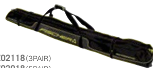
Z02118(3PAIR) Z02918(5PAIR) Z02818(5PAIR/ホイール付)