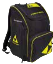
Z01318 / Z03518 / Z05218

Material) 100% Polyester Volume) Z01318: 40L Z03518: 55L Z05218: 70L